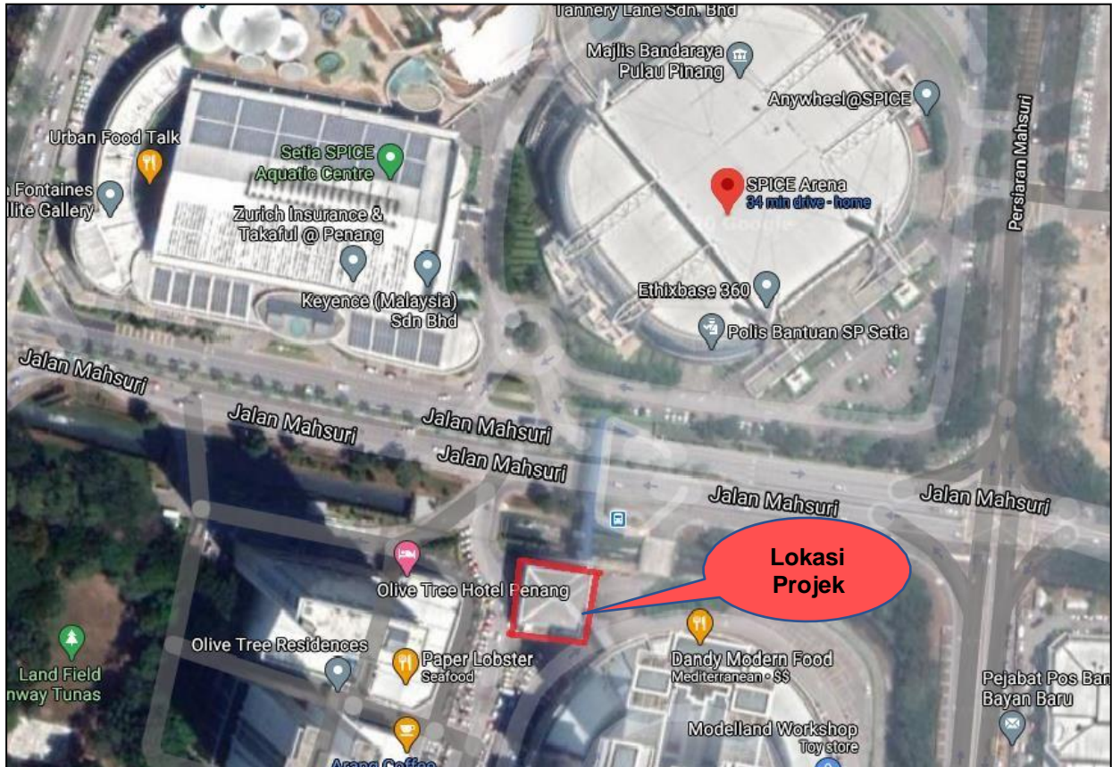
Pelan Lokasi Bangunan 'Bus Interchange' Dan 'Overhead Linkway', Mukim 12, Daerah Barat Daya (DBD), Pulau Pinang