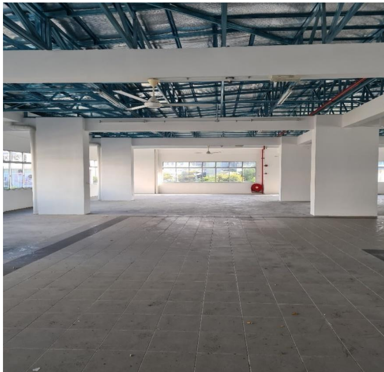
Ruang Tingkat Atas Bangunan 'Bus Interchange' Dan 'Overhead Linkway'

Cadangan pembangunan dan pengurusan medan selera dan ruang niaga ini terletak di Tingkat Atas Bangunan 'Bus Interchange' Dan 'Overhead Linkway', Mukim 12, Daerah Barat Daya (DBD) Pulau Pinang. Bangunan ini terletak bersebelahan Olive Tree Hotel dan berhampiran Setia Spice Arena. Ruang bahagian atas bangunan ini berkeluasan 635.32 meter persegi. Ruang bawah bangunan digunakan oleh pihak Rapid Bus Sdn. Bhd. sebagai terminal bas.