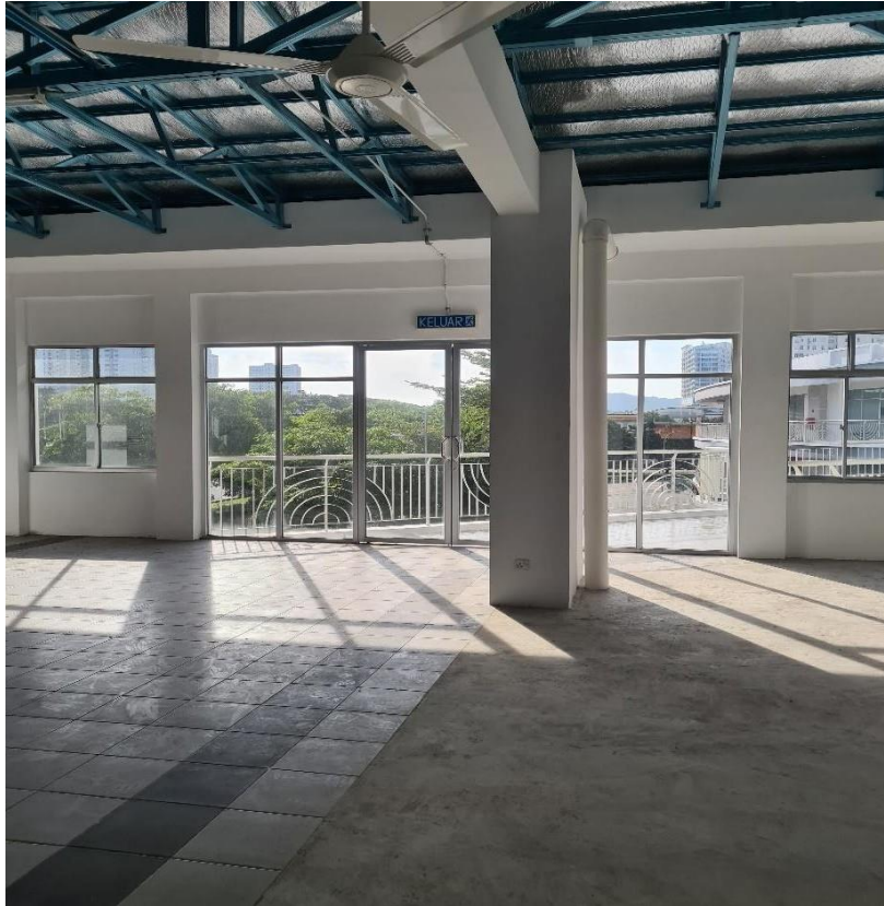
Ruang Tingkat Atas Bangunan Bus Interchange' Dan 'Overhead Linkway'

CMI sebagai pemilik bangunan akan memeterai Perjanjian Konsesi bersama Pembida yang berjaya bagi tempoh 5 + 5 tahun di bawah terma-terma dan syarat-syarat yang dipersetujui bersama.